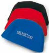
Poggiatesta Headrest cushion Reposacabezas 01008