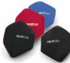
Coppia poggiaeni laterali Pair of lumbar side backrests Par de reposariñones laterales 01022