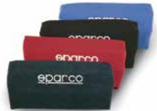
Poggiaeni universale centrale Universal lumbar backrest Reposariñones universal central 01023