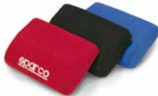
Poggiagambe Leg support cushion Reposapiés 01011